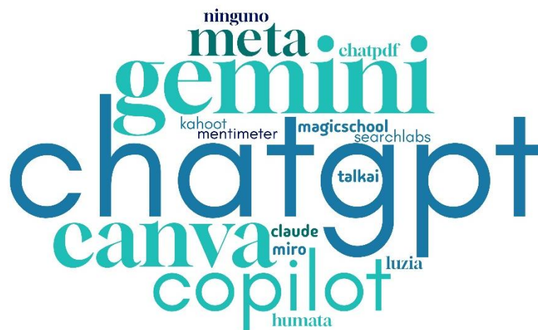
Figura 1. Palabras más repetidas en las respuestas de los docentes sobre las herramientas de IA que utilizan usualmente

En la Figura 1 se aprecia una gran diversidad de herramientas que los profesores utilizaban, antes de la capacitación. No obstante, las respuestas se concentran en el ChatGPT, palabra que toma mayor relevancia en el centro de la nube, seguida por Gemini, Canva, Copilot y Meta.